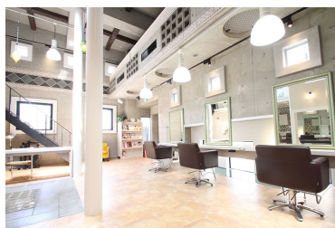
ヘアサロン スタジオ

スチール撮影やムービー撮影に最適なカフェスタジオやギャラリーのほか、普段はヘアサロンや Bar として営業をしているスペース、屋外スペースなど幅広いニーズに対応できます。